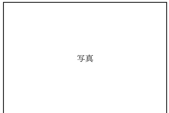
1年生は初めての図書ボランティア読み聞かせ