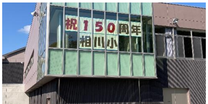
校門からすぐ目に入る体育館の表示